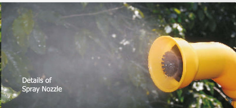
Details of Spray Nozzle