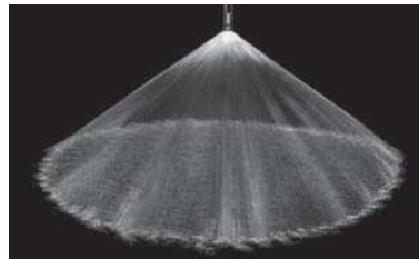
Cône plein 120°