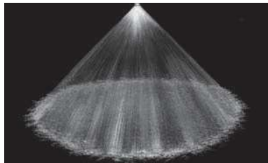
Cône plein 90°