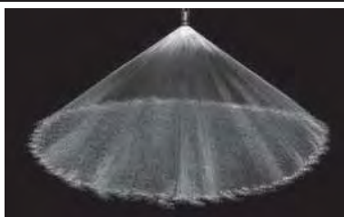
Cône plein 120° (W)