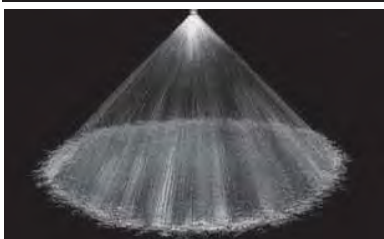
Cône plein 90°(M)