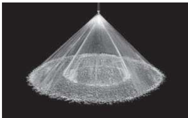
Cône plein 90° (XPN)