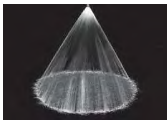
Cône plein 60° (N)