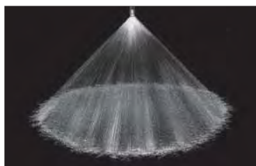
Cône plein 90° (M)