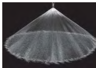
Cône plein 120° (W)

Les dimensions sont approximatives. Voir BETE pour toute demande particulière.